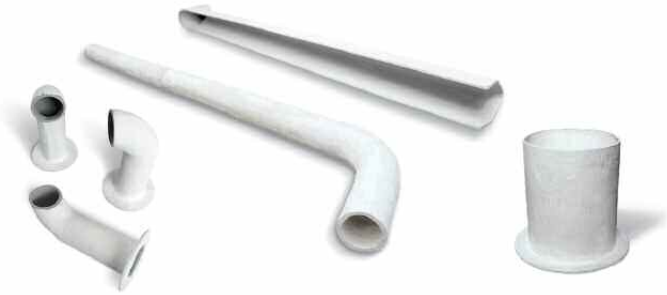
Ausgießrohre mit Bogen, D_i=48\text{mm}