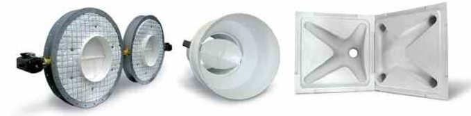
Klappe DN 450 isoliert und in Gehäuse DN 900 integriert